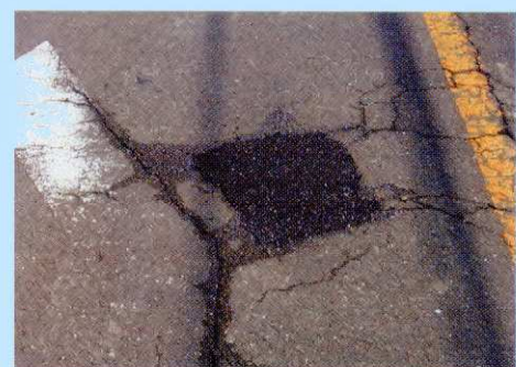
4.補修完了 時間の経過とともに安定します。