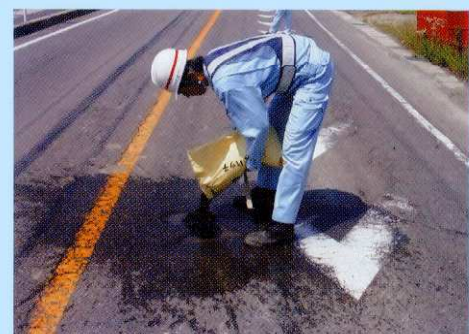
2.補修材投入 補修箇所にあすファルトピッチを投入してください。