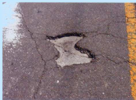
1.補修前作業 陥没や痛んだ路盤のゴミを取り除きます。