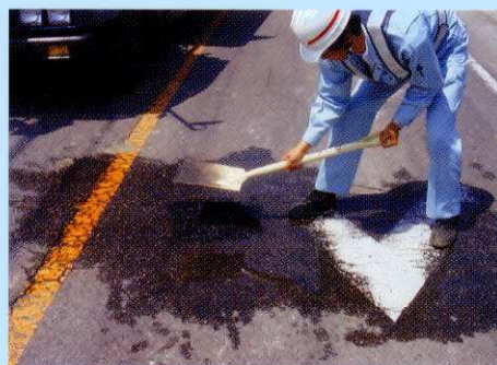
3.補修材敷き均し 充填したアスファルトピッチをスコップで均し、余盛(約1~2cm程度)して平らにしてください。